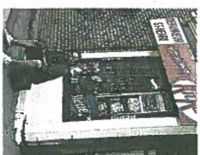
À l'affiche au Cinéma Parallèle.

Ces habitants du coin se racontent donc un peu au passage, parlent de leur vie dans ce quartier populaire en mutation, marqué par l'appartion de l'échangeur Turcotte, l'immigration, la transformation d'anciennes usines en condos de luxe... Mais, Shannon Walsh veut nous montrer qu'il